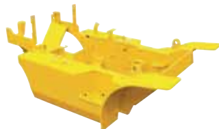
Мощная цельная рама