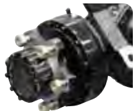
Мокрые дисковые тормоза