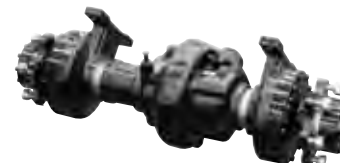
Высокопрочный ведущий мост